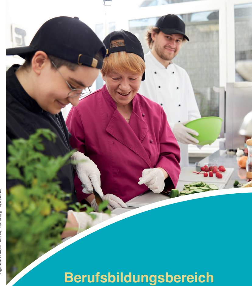
Agentur: Ralph Kiesel, Hamburg - 1./09/2025

Impuls Reha & Arbeit gGmbH Nagelsweg 10, 20097 Hamburg Telefon 040 / 29 848-100 www.impuls-reha.de