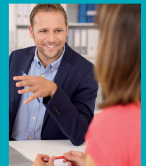
Adobe Stock, contrastwerkstatt „Beratungsgespräch“

Info-Telefon: 040 / 29 848-222 E-Mail: beratung@impuls-reha.de