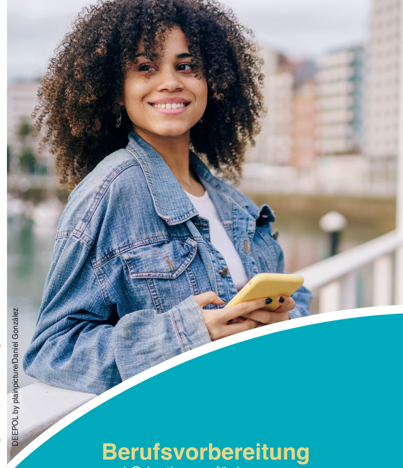
Agentur: Ralph Kiesel, Hamburg - 1./09/2025 DEEPOL by plainpicture/Daniel González

Impuls Reha & Arbeit gGmbH Nagelsweg 10, 20097 Hamburg Telefon 040 / 29 848-100 www.impuls-reha.de