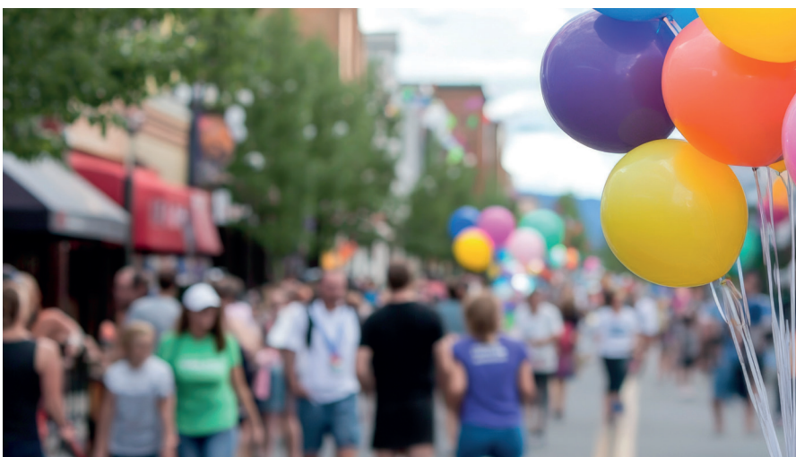
Stimmungsbild Stadtteilstfest

...das war unser Anliegen auf dem Stadtteilstfest St. Georg