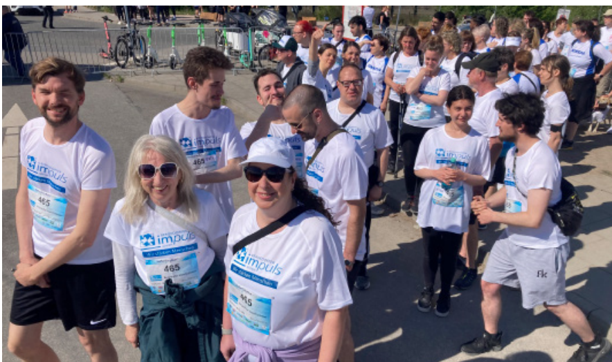
Ein Team von 24 Läufer*innen ging gut gelaunt an den Start, zum letzten Mal im Trikot der Bergedorfer Impuls gGmbH

Wir freuen uns schon auf das nächste Mal!