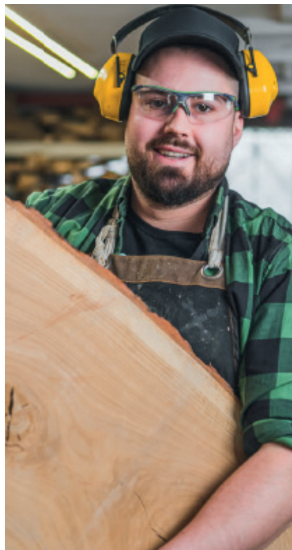
Lebendige Praxis - eine Berufsausbildung z.B. in unserer eigenen Tischlerei.

Im Rahmen der Ausbildung bieten wir Unterstützung, die sich an den individuellen Voraussetzungen orientiert. Darüber hinaus können die Auszubildenden ihre sozialen Kompetenzen ausbauen und ihre Persönlichkeit weiterentwickeln. Hierzu gehört